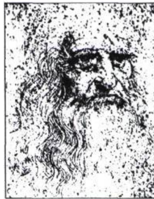
Léonard de Vinci

On retrouvait beaucoup ce genre d'affirmation chez les porte-parole des mouvements radicaux des années 1970. Un discours qui redevient actuel puisque, à la suite des situationnistes Raoul Vaneigem et Guy Debord, il est repris par André Gortz dans Métamorphoses du travail, quête du sens chez Galilée. ●