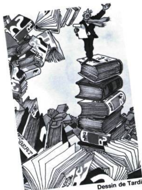
Dessin de Tardi