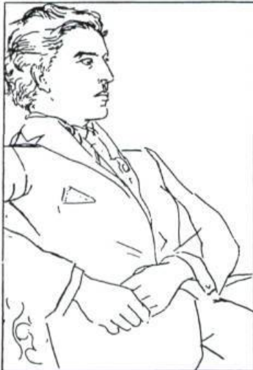
André Breton par Picasso