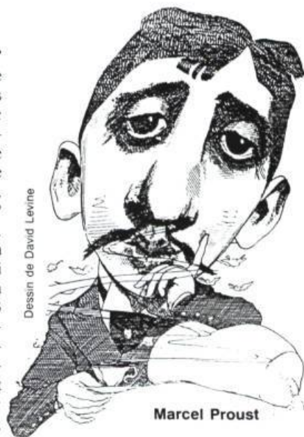
Dessin de David Levine

Loin de nous l'idée de discréditer les nobélisés. Quant au prix... ●