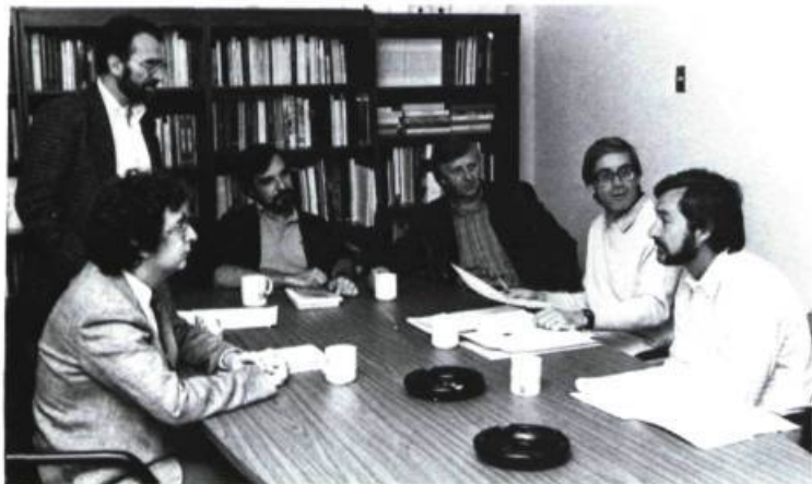
Le bureau de direction des éditions du Boréal

L'express Boréal: En se restructurant entièrement, les éditions du Boréal viennent de franchir un pas important pour la diffusion de leurs livres à l'étranger. L'association avec les éditions du Seuil (actionnaire minoritaire) et l'intégration de nouveaux actionnaires québécois permettront au Boréal de diffuser directement ou en coédition des livres choisis pour l'étranger. Ainsi, dans les prochains mois, seront distribués un roman de Robert Lalonde, un essai de Northrop Frye et une étude de Jorge Niosi et Bertrand Bellon. Du même souffle, le Boréal annonce la parution des prochains livres de Pierre Turgeon, Claude Charon, Robert Lalonde, André Major ainsi que la correspondance de Gabrielle Roy. ●