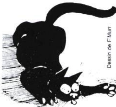
Dessin de F. Murr

Enfin, Le chat et la palette d'Elisabeth Foucart-Walter et Pierre Rosenberg (Adam Biro), une recherche iconographique et une étude sur la représentation symbolique du chat dans la peinture occidentale, comblera les amateurs d'art... et de chats. ●