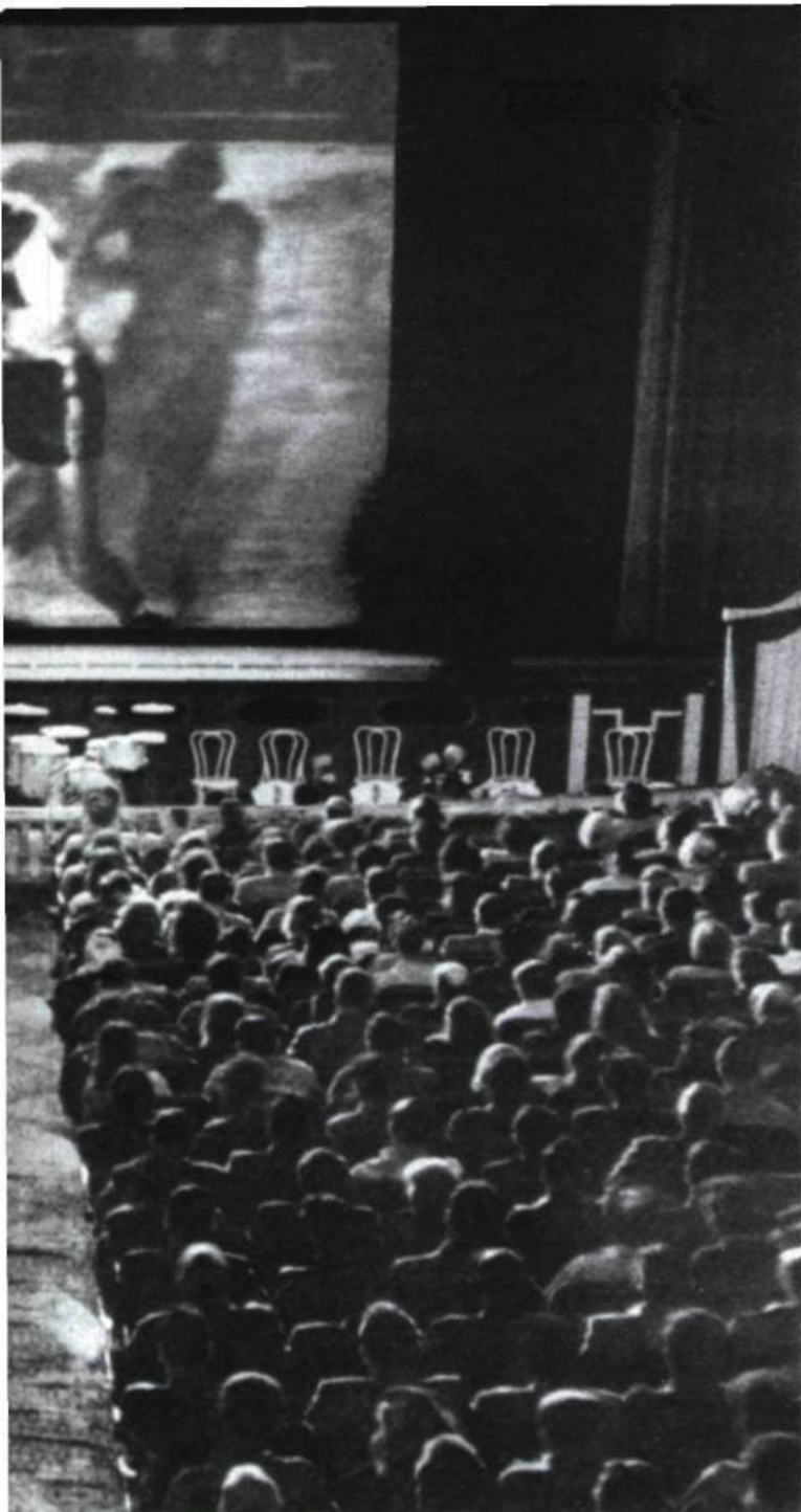
du combat contre le Chilien Arturo Godoy