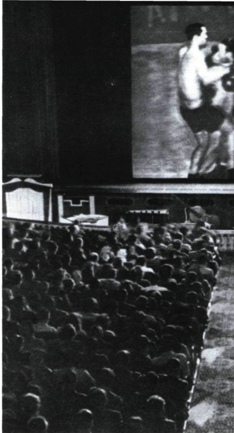
Joe Louis est devenu personnage de fiction dans Au tapis de S. Kaminsky

On appelle cela une détente, ces trois heures pendant lesquelles on s'échinera à percer les astuces du criminel sans être assuré d'être payé de ses efforts. — T'en fais une tête ce matin... T'as passé la nuit sur la corde à linge? — Pire, je l'ai passée à lire un polar. Tu vois le genre: je suis incapable de m'arrêter en chemin. — C'était bon? — Même pas.