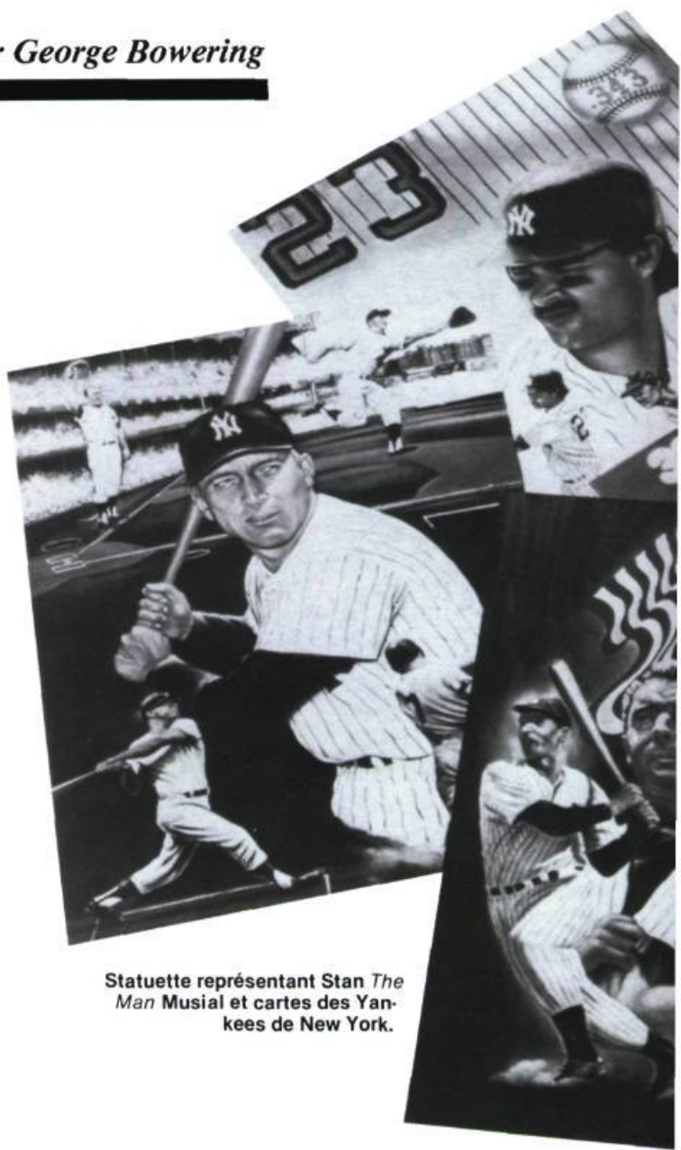
Statuette représentant Stan The Man Musial et cartes des Yankees de New York.

La situation n'a pas tellement changé. Bien sûr, depuis quelques années, ça fait bien de se précipiter aux matches, de s'arracher les livres sur le baseball, mais il y a encore des tas d'écrivains, et surtout de critiques, qui me