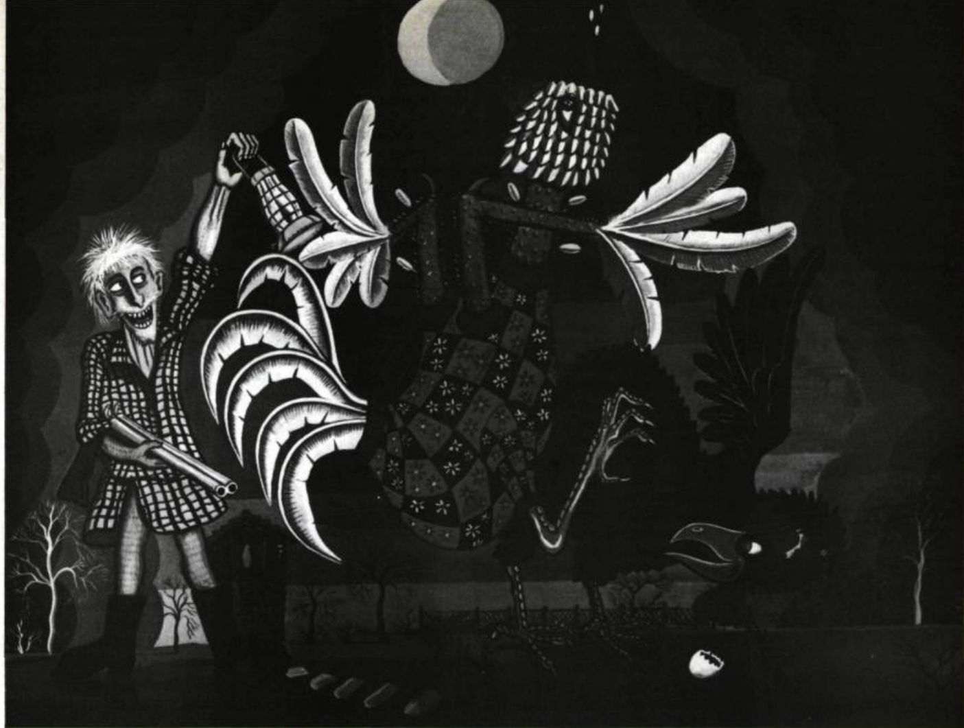
Autre histoire de Gal et de Galine (détail) par Gérard Lattier, faiseur-montreur-diseur d'images peintes occitanes. Extrait de Lattier ou la mémoire en couleurs , éditions de Candide, 1981.