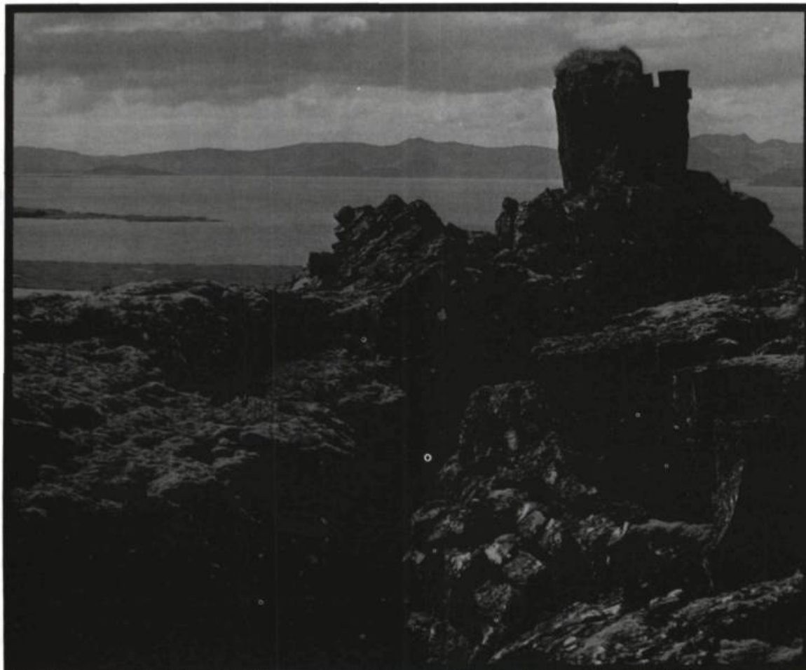
Adossé à ces rochers de Thingvellir, l'orateur pouvait aisément se faire entendre des membres de l'Althing.

Pour les anciens Nordiques, assumer son destin signifiait que, sous aucun prétexte, ils ne pouvaient tolérer qu'on empêche celui-ci de se réaliser. Dans de telles conditions, rarissimes seront les héros de sagas qui ne se vengeront pas lorsqu'ils se considéreront victimes d'un affront. Peu importe si elle doit s'exercer sur des personnes qu'on aime ou que l'occasion de la pratiquer ne se présente que plusieurs années après que l'offense ait été subie, la vengeance sera un droit, un droit inaliénable.