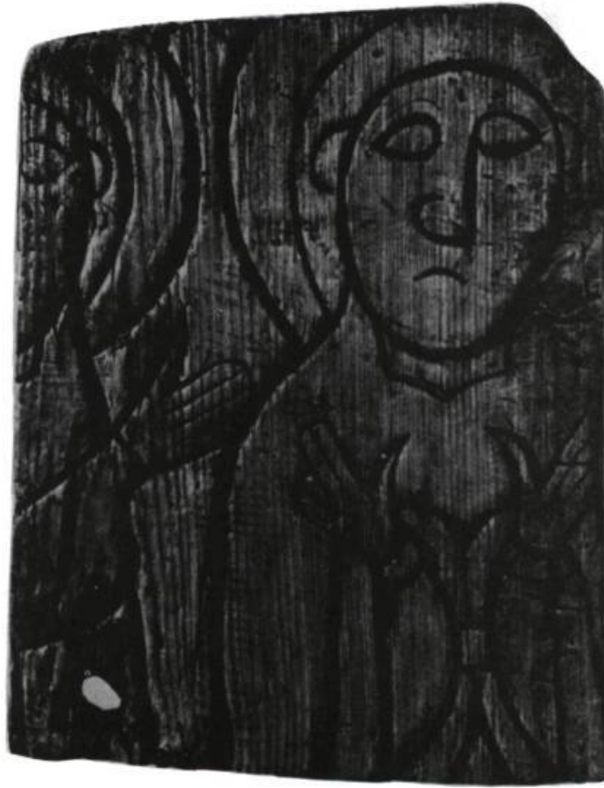
Panneau mural islandais du XI e siècle représentant un saint en prière.