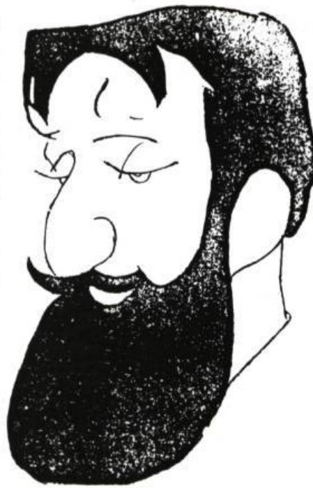
Horacio Quiroga, dans La Nación , le 15/1/1922