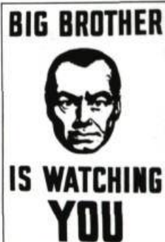
Affiche du film «1984»