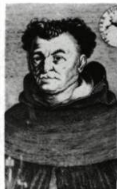
Tommaso Campanella (1568-1639)