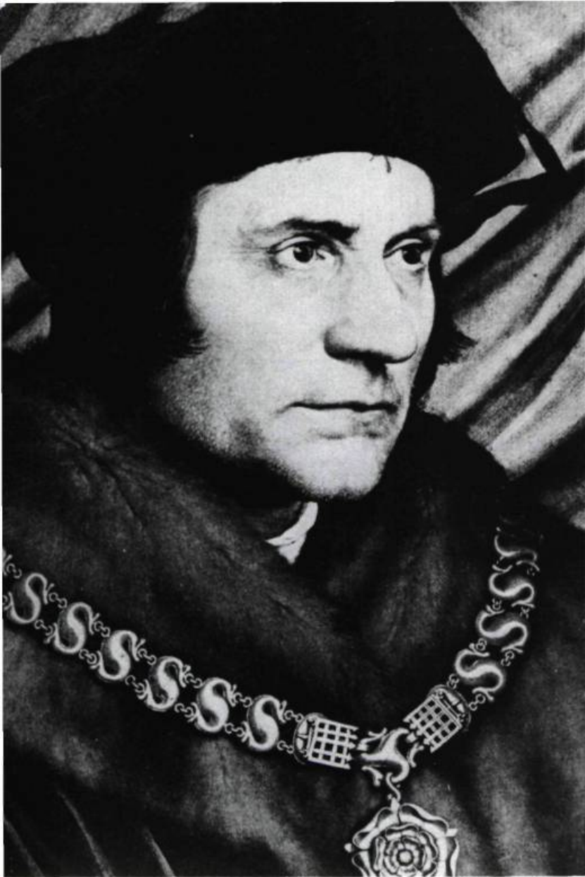
Sir Thomas More inventa le mot «Utopie» en 1516. Chancelier d'Angleterre, il fut décapité pour avoir refusé de prêter le serment d'allégeance à Henri VIII contre le pape. En 1969, il fut canonisé par l'Église catholique.