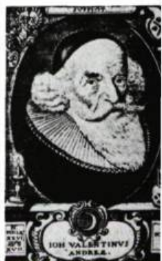
John Valentin Andrae (1586-1654)