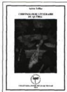
Chronologie littéraire du Québec Sylvie Tellier. 350 pages 18,50 $