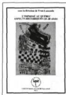
L'imprimé au Québec — Aspects historiques (18 e — 20 e siècles) sous la direction de Yvan Lamonde. 371 pages 18,00 $