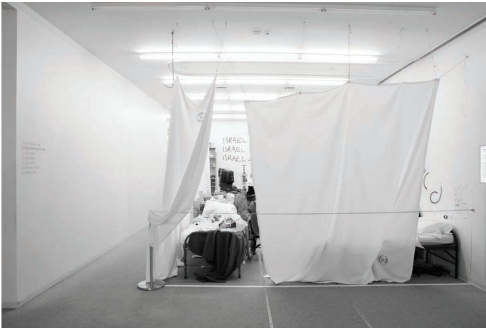
Michael Blum, "Exodus 2048", New Museum, New York, 2009.