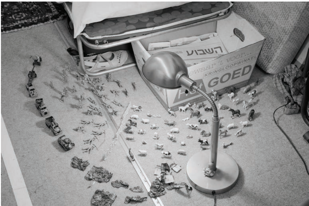
Michael Blum, "Exodus 2048", New Museum, New York, 2009.