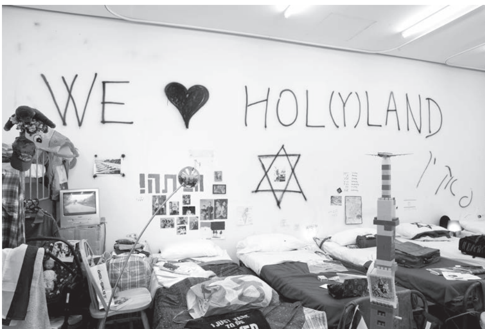
Michael Blum, "Exodus 2048", New Museum, New York, 2009.