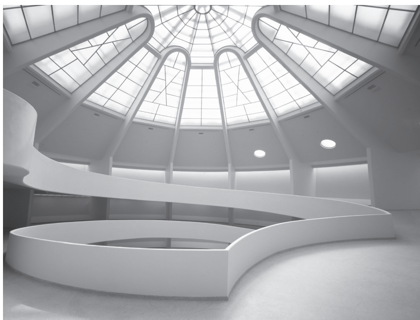
Vue sur la rotonde du musée. The Solomon R. Guggenheim Museum, New York.