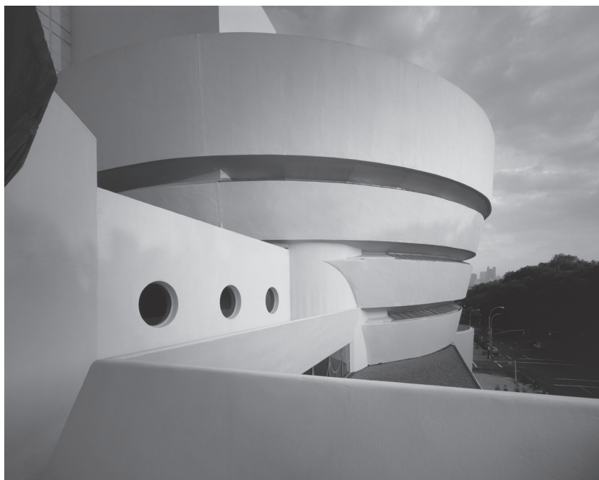
The Solomon R. Guggenheim Museum, New York. © The Solomon R. Guggenheim Foundation, New York. Used with permission [Photographe : David Heald].