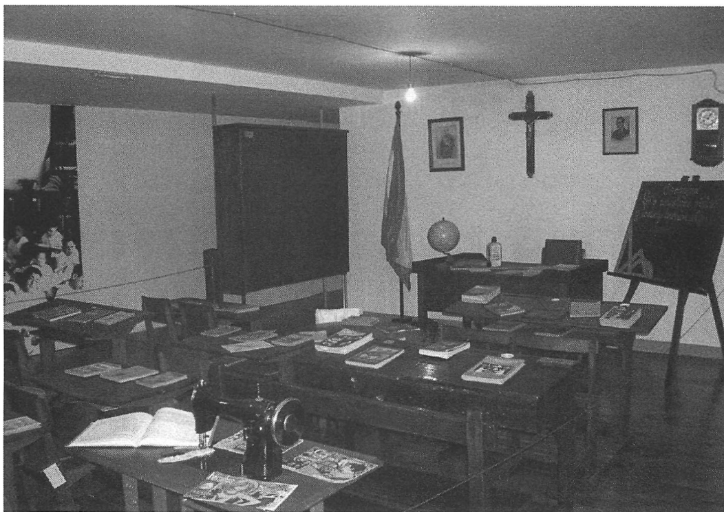
«Aula de Franquismo 1939-1975», Museo Pedagógico de Galicia.