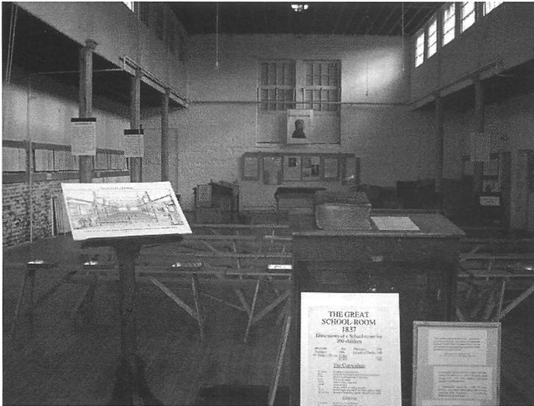
«The great Lancasterian Schoolroom» (1837) British Schools Museum Hitchin.