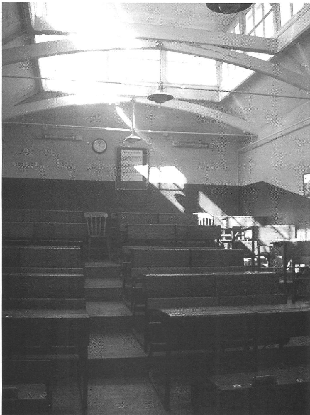
«The Galleried classroom» (1853) British Schools Museum Hitchin. Photographie : Myriam Boyer, 2007