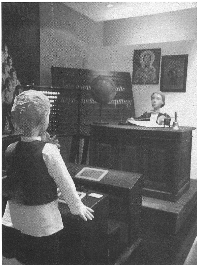
Évocation d'une salle de classe d'une école primaire (vers 1900). Pedagoški muzej de Belgrade. Photographie : Myriam Boyer, 2007