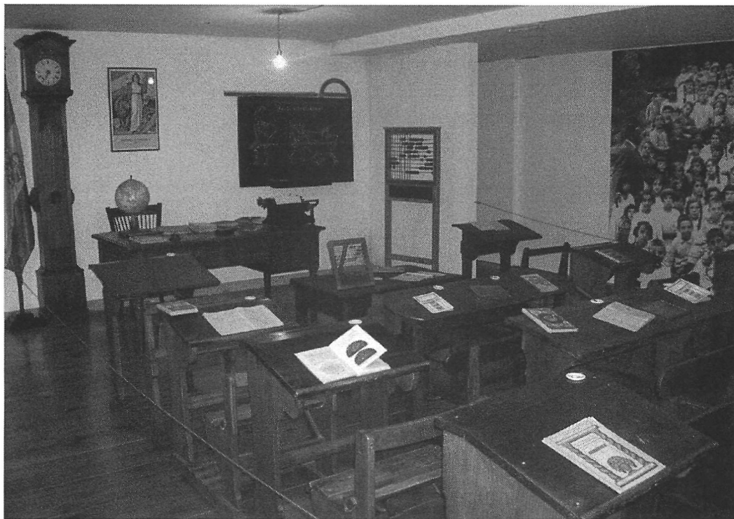
«Aula de Republica 1931-1936» Museo Pedagógico de Galicia.