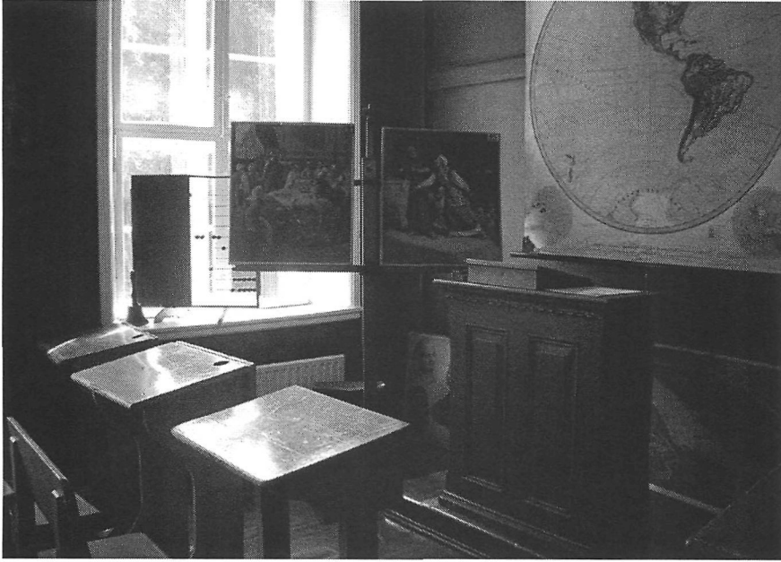
Reconstitution d'une salle de classe de l'école primaire (première moitié du XX e siècle) «Folkeskolens klasserom», Bergen Skolemuseum. Photographie : Myriam Boyer, 2007