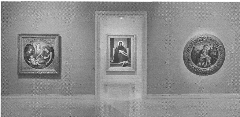
Musée des beaux-arts de Strasbourg.