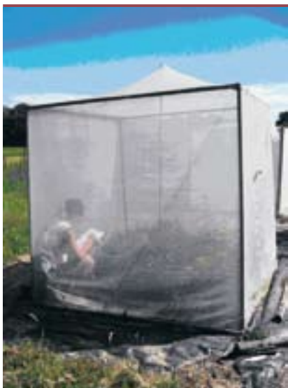
Figure 2. Séance d'observation du comportement de butinage.

Nous avons constaté que l'impact des traitements de pollinisation sur le succès reproducteur des plantes n'est pas le même dans les trois communautés végétales expérimentales. Dans les communautés composées uniquement du groupe fonctionnel « fleurs en assiette », le succès reproducteur est identique, quelle que soit la diversité des pollinisateurs. En revanche, dans les