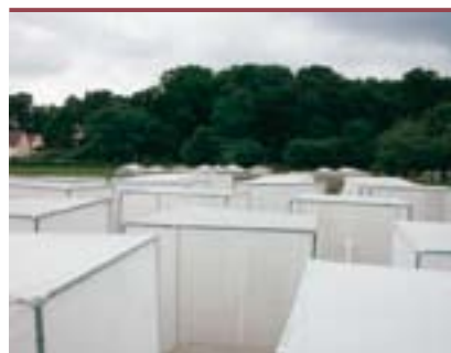
Figure 1. Vue générale du dispositif utilisé sur le terrain, avec les cages à pollinisation en voile de nylon contenant les communautés expérimentales de plantes et de pollinisateurs.

Nous avons créé des communautés végétales expérimentales, en faisant varier la diversité fonctionnelle des plantes. Au total, il y avait trois types de communautés végétales, contenant soit l'un, soit l'autre, soit les deux groupes fonctionnels de plantes, à densité contrôlée. Toutes les communautés (36 en tout) ont été recouvertes de cages cubiques en voile de nylon afin d'en contrôler la pollinisation (Figures