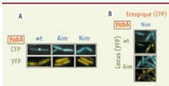
Figure 2. Effet des mutations de rupture d'interaction sur la localisation subcellulaire de yabA. A. YabA et ses dérivés sont étiquetés par la YFP ou la CFP et exprimés dans B. subtilis . Les observations sont réalisées par microscopie à épifluorescence sur cellules vivantes. YabA localise de façon réplisomale en formant un focus au centre de la cellule. L'introduction des mutations de perte d'interaction à DnaN (Nim) et à DnaA (Aim) se traduit par la perte de la capacité à former des focus et la localisation devient diffuse dans la cellule. B. Restauration de la localisation par complémentation entre yabA Aim et Nim. La co-expression dans la cellule d'un YFP-YabA et d'un mutant CFP-Nim s'accompagne de la re-localisation du mutant Nim, indiquant que ce dérivé muté participe à la formation d'un hétérocomplexe fonctionnel avec la protéine YabA sauvage. La co-expression des deux mutants CFP-Nim et YFP-Aim complète leur déficience pour la localisation et restaure la formation de focus par le complexe YabA/DnaA/DnaN au centre de la cellule.