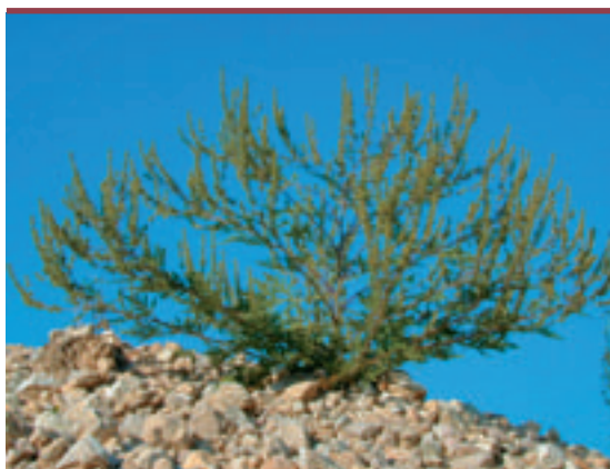
Figure 1. Ambrosia artemisiifolia L.

In France, common ragweed ( Ambrosia artemisiifolia L.) is an invasive species, which most probably originates from North America. This plant is responsible for human health problems as the pollen causes allergic rhinitis and seasonal asthma ; in addition, it engenders agronomical problems as the efficient herbicide treatments are few. Consequently, various departments of the Rhône-Alpes region set up eradication programs for common ragweed. The species is distri-