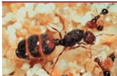
Figure 3. La reine de la fourmi de feu. Chez Solenopsis invicta , c'est la reine qui détermine la valeur du sex-ratio en pondant un nombre plus ou moins grand d'œufs haploïdes (mâles).

L'exemple de Dinoponera quadriceps est démonstratif de ces luttes intestines. La reproduction est réglée par l'existence d'une hiérarchie de dominance, la gamergate occu-