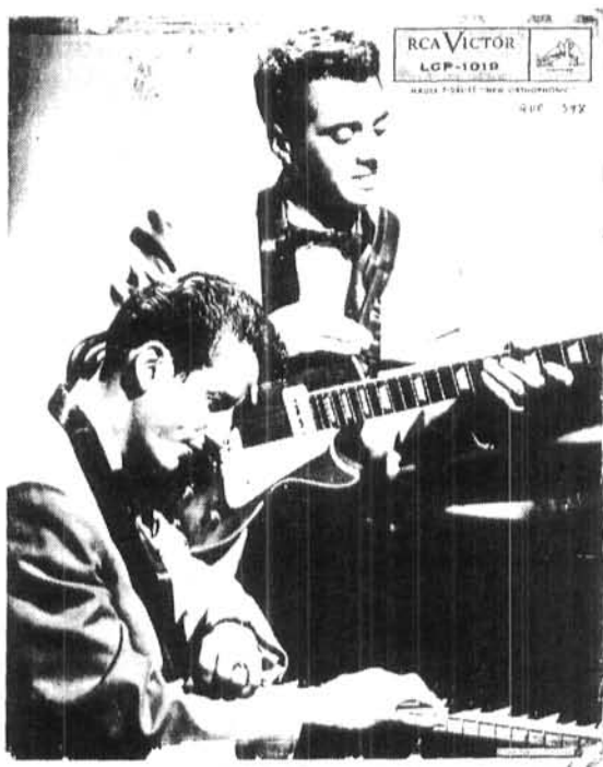
Pochette de disque RCA Victor LCP-1019