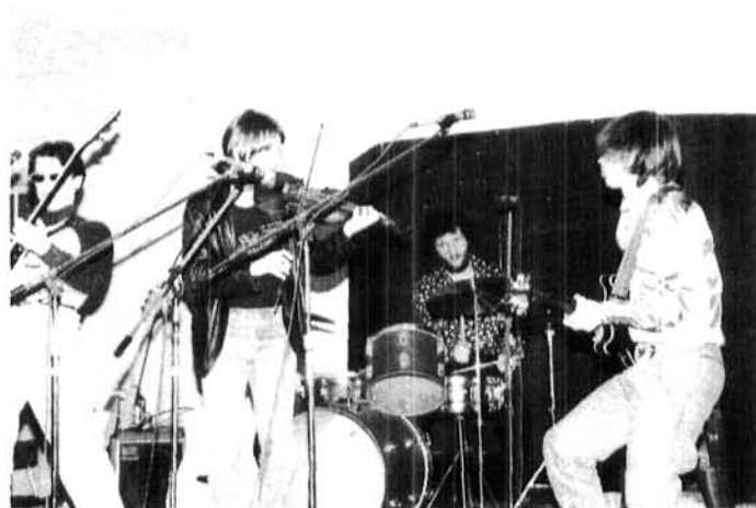
LES VULG-AIRS, 1987