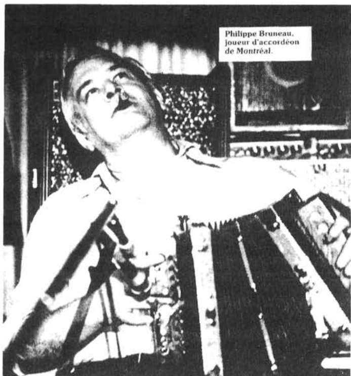
Photo de Gilles Barand, tirée du collectif Lâchés louses , VLB, 1982