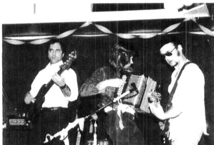
LES VULG-AIRS, 1985