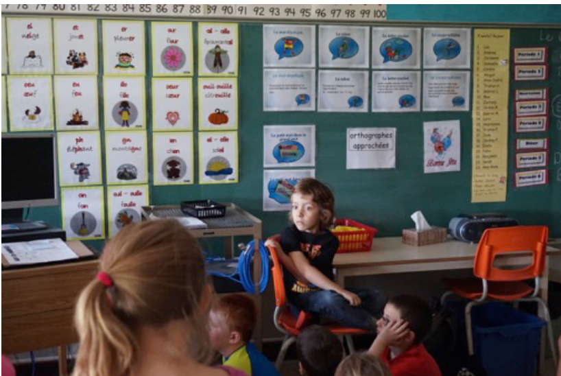
FIGURE 8. Accessibilité du matériel d'écriture dans la classe de l'enseignante 2