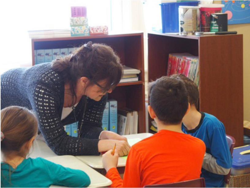
FIGURE 3. La collaboration entre les élèves et l'enseignante 2