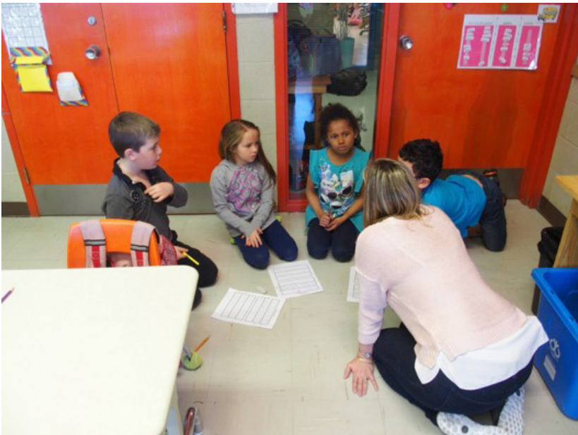
FIGURE 2. La collaboration entre les élèves et l'enseignante 5

Enfin, toutes les pratiques d'orthographes approchées observées favorisaient la collaboration entre les élèves et l'enseignant lors de la troisième phase des orthographes approchées lorsqu'ils doivent échanger entre eux sur la graphie qu'ils ont produite et les stratégies orthographiques utilisées. Les élèves discutaient entre eux et les enseignantes prenaient part aux discussions tout en faisant de l'étayage. Les Figures 2 et 3 présentent des enseignantes collaborant avec les élèves lors de cette phase et les Figures 4 et 5 illustrent la collaboration entre les élèves.