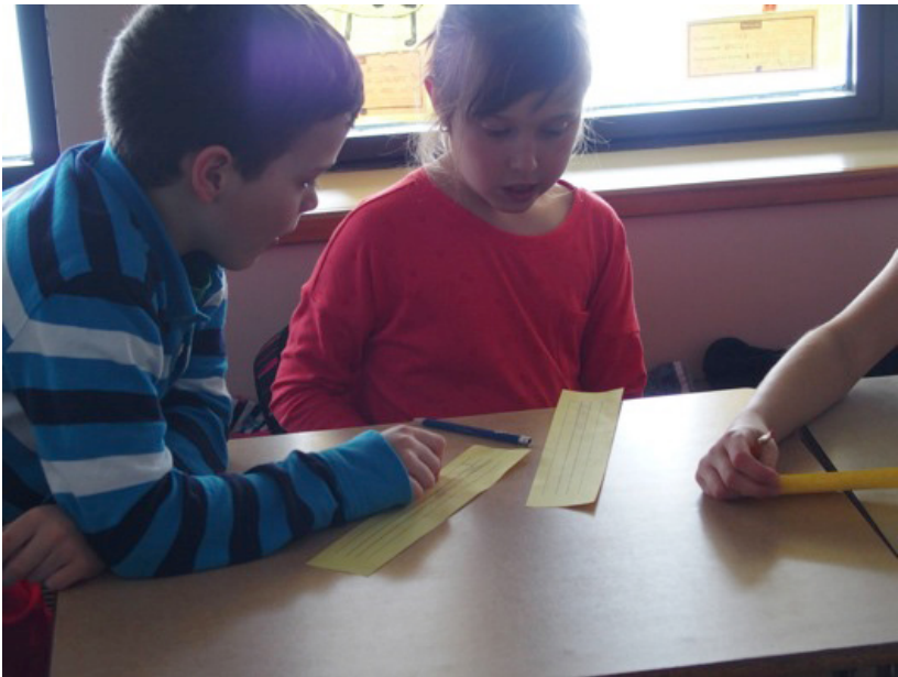
Figure 4. La collaboration entre les élèves de la classe de l'enseignante 4