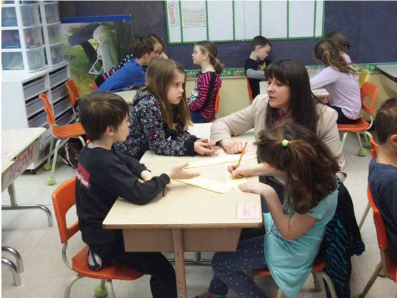
FIGURE 7. Position de l'enseignant dans la classe de l'enseignante 3