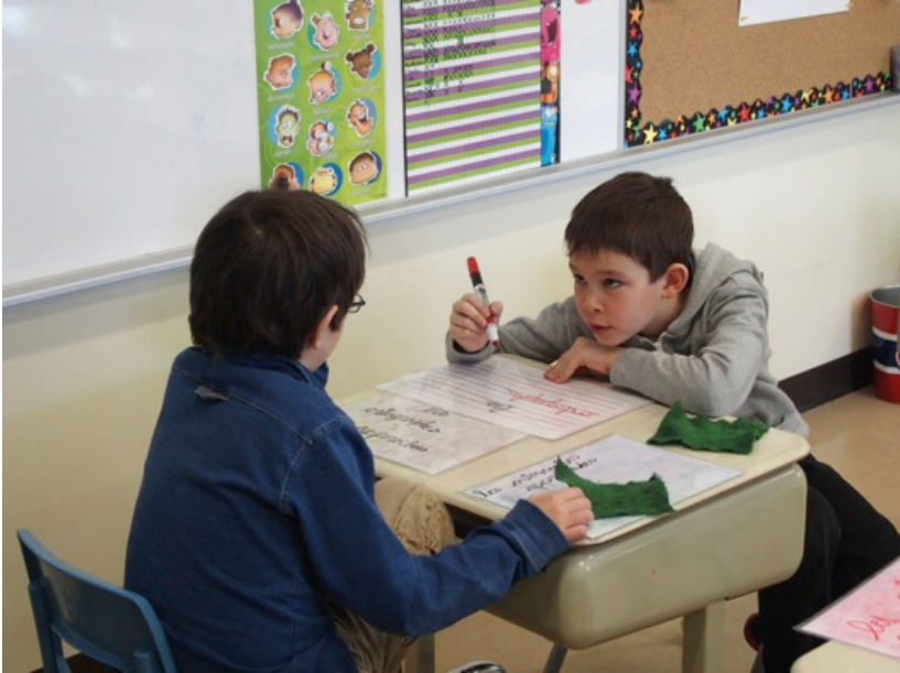
Figure 5. La collaboration entre les élèves de la classe de l'enseignante 1