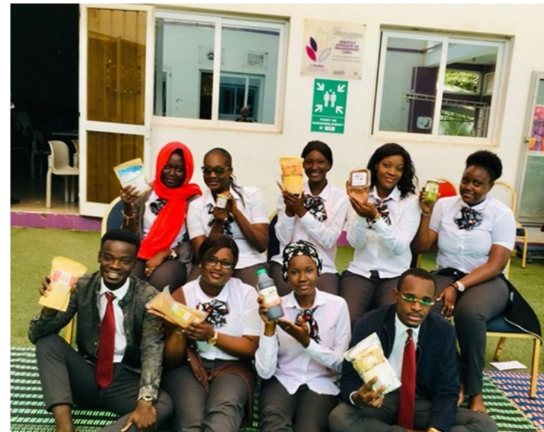
Photo prise à l'issue d'une séance du Module « Pratique d'Entreprise »

Certains apprenants n'étant pas réguliers sur la remise de leurs devoirs au coach ont bizarrement changé de comportements depuis qu'on a quitté les tables en classe pour s'asseoir sur les nattes et de plus sur les espaces en plein air (Logique Habituelle chez les Africains).