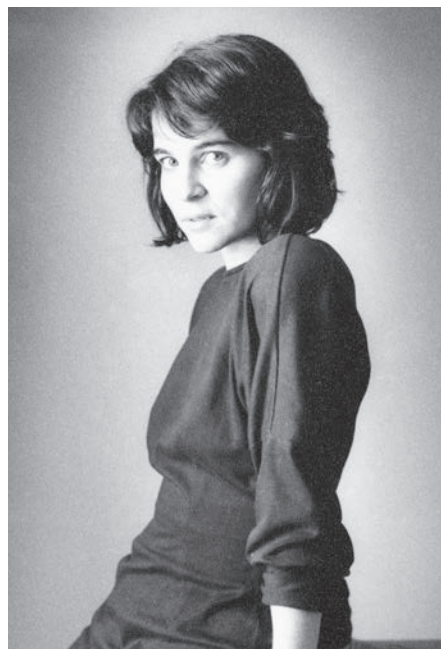
Comme de nombreux clichés de Pordán, les sujets de ces quatre portraits sont non identifiés. Musée de la Gaspésie. P268. Fonds Ladislav Pordán