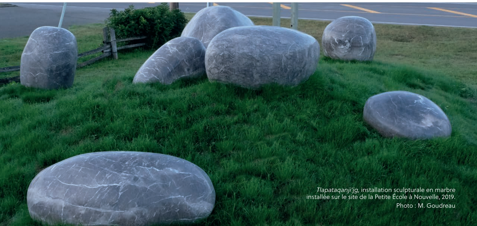
Tlapataqanji' , installation sculpturale en marbre installée sur le site de la Petite École à Nouvelle, 2019.