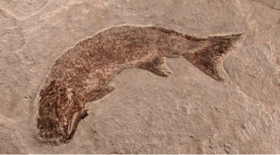
Cheirolepis canadensis , un poisson à nageoires rayonnées de Miguasha.