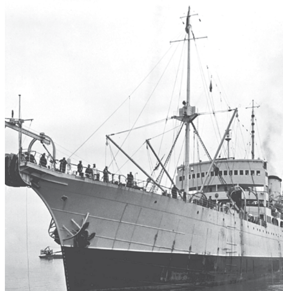
Le bateau le Monarch , le plus gros câblé au monde utilisé pour la pose des câbles sous-marins, vers 1953.

En 1959, rien ne va plus : les pannes sont récurrentes ; il faut faire quelque chose. Hydro-Québec planifie depuis le début des années 1950 de construire une ligne en provenance du complexe Bersimis vers la Gaspésie, mais celle-ci n'est pas encore prête. Une solution temporaire est mise en place