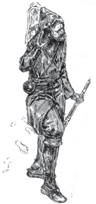
Un marcheur, début du 20 e siècle.