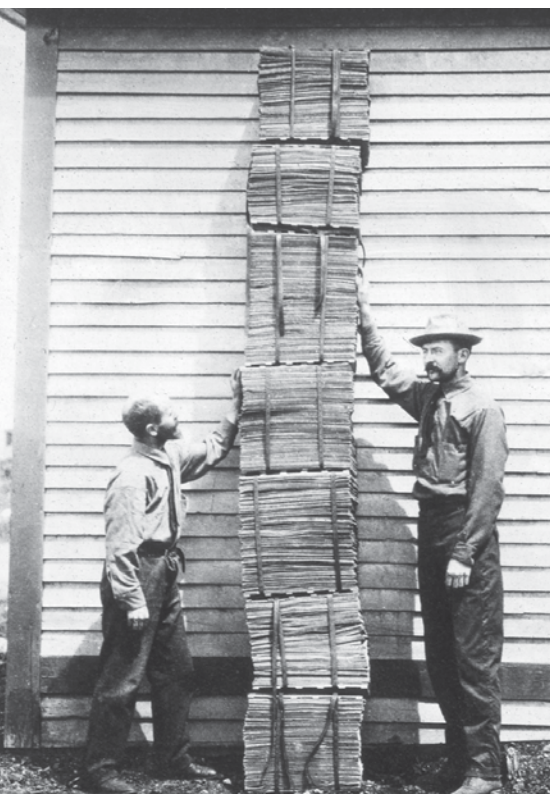
Merritt Lyndon Fernald (à gauche) et son acolyte James Franklin Collins autour d'une impressionnante pile de presses à plantes.

Fernald fait son premier voyage d'exploration au Québec au début du 20 e siècle. En 1902, il prolonge vers le nord une visite dans le Maine, pour ensuite suivre le trajet de l'Atlantic and Lake Superior Railway de Matapédia jusqu'à New Carlisle. Il prospecte la zone comprise entre l'embouchure de la rivière Bonaventure, à l'ouest, et Port-Daniel, à l'est. Peu enthousiasmé par ses premières