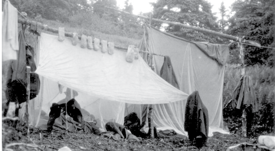
Campement lors d'une expédition en Gaspésie, 1923.