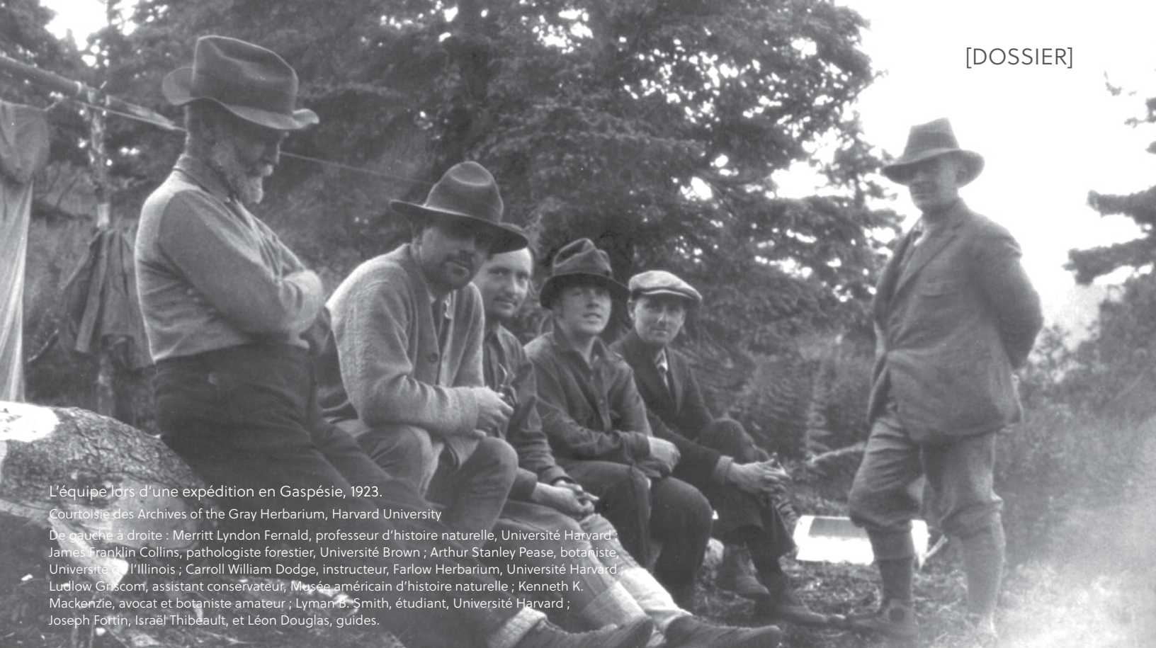
L'équipe lors d'une expédition en Gaspésie, 1923.