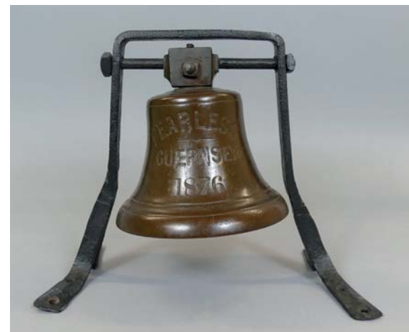
Cloche du Fearless , devenue la cloche d'une école à Percé, 1876.