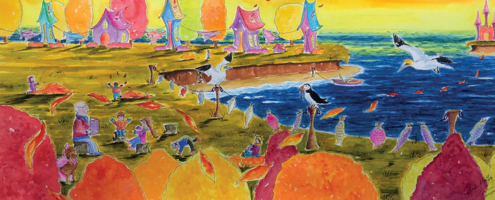
Un grand-père raconte une histoire aux enfants, aquarelle, 2018.