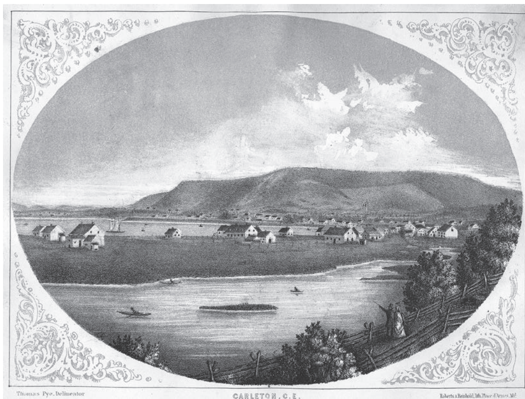
Le banc de Carleton, un lieu idéal pour la construction navale.

Pour construire une goélette, il faut bien sûr du bois, des hommes habiles en charpenterie ainsi qu'un lieu à proximité de l'eau. En première étape, on construit d'abord la structure de base, soit la quille, l'étrave et l'étambot 2 . Dans un deuxième temps, une fois que le squelette de la goélette est monté, les bordages sont fixés sur les baux ou