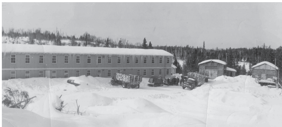
Vue d'ensemble du camp 74 de la Gaspésia dans les années 1960.

On y retrouvait les commodités nécessaires pour y vivre toute la semaine; du lundi au samedi. Les travailleurs pouvaient manger, dormir, prendre leur douche, laver et sécher leur linge, bénéficier d'une salle de repos avec radio et jeux, en plus d'un petit magasin pour le gaz, l'huile, le crochet à bois de corde, les cigarettes, les pantalons, les gants, les pièces