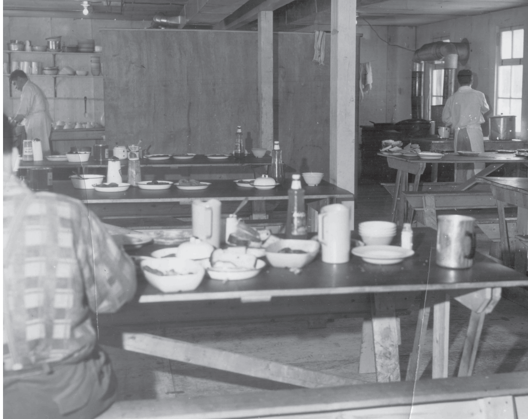
Cuisine au camp 74 de la Gaspésia dans les années 1960.

Le chef cuisinier en plus de sa fonction de superviseur, avait la tâche d'établir les menus pour la semaine. Il s'occupait des pâtisseries, du pain de ménage sous toutes ses formes et de la cuisson des viandes. Évidemment, il avait la fonction d'établir la liste d'épicerie. Il lui arrivait à l'occasion de donner un coup de main pour faire une soupe ou un quelconque plat spécial, surtout au déjeuner. Il fallait faire vite. C'était la folie furieuse! Tous voulaient des œufs, des saucisses, des fèves au lard, des rôties, des crêpes, et ce, en même temps et très chauds s'il vous plaît! Il