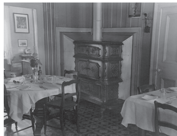
Salle à manger de La Vieille Maison dans les années 1940.