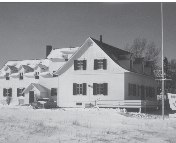
Photo ayant servi de carte postale de La Vieille Maison, 1975.