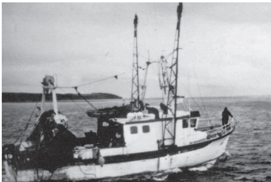
Départ du Bout-de-Ligne pour son voyage fatal. On aperçoit les deux stabilisateurs de métal fixés sur le bateau en position verticale, novembre 1990.