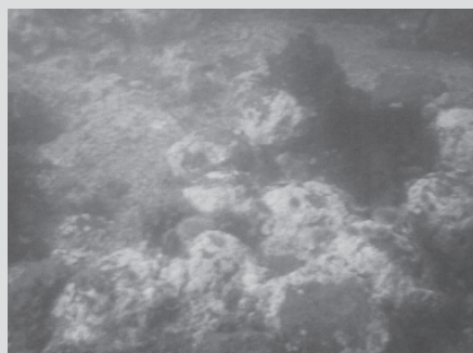
Amoncellement de boulets de canon sur le site de l'épave de l' Antigua .

Les amis et partenaires en plongée sous-marine Alain Therrien et Serge Boucher de Tourelle ont visité le site et pour immortaliser ce triste centenaire, ils ont procédé, à l'été 2011, à l'installation d'une plaque commémorative de l'événement sur le treuil de l'épave 4 .