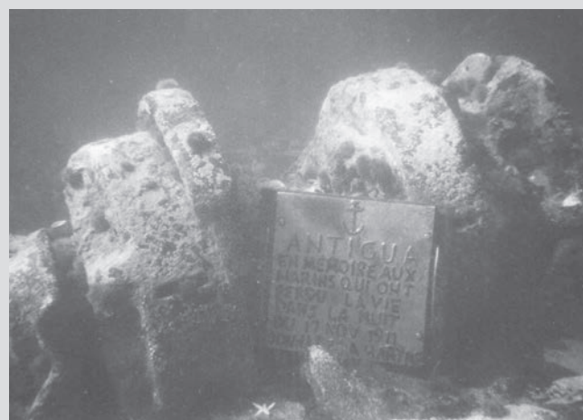
Plaque commémorative sur le site de l' Antigua .