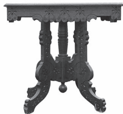
Table provenant du Colborne .

les églises protestantes du Bas-Canada. De plus, la cargaison compte toute une collection de vaisselle d'argent, spécialement commandée par Sir John Colborne, commandant en chef des troupes anglaises au Canada et grand amateur de belles choses.