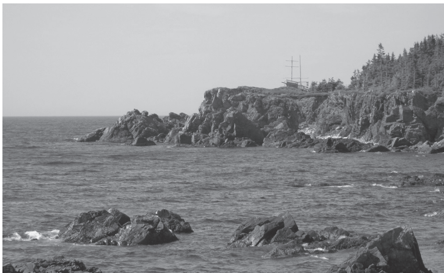
Parc commémoratif du Colborne à Gascons. Photo : Michel Goudreau.

Le naufrage du Colborne est aussi entré dans la tradition orale. Dans son livre Le vaisseau fantôme – Légende étiologique , sœur Catherine Jolicoeur, spécialiste de la recherche ethnolo-