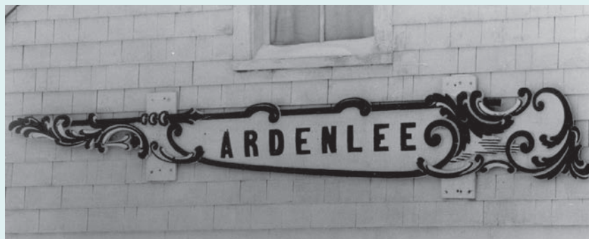
Cette enseigne provenant du navire Ardenlee a orné la boutique de souvenirs qu'a tenue à Gaspé madame Percival G Hyman (Isabella Reynolds) jusqu'en 1980.

Un mois après le naufrage, Marguerite Cormier, une rescapée qui semble avoir beaucoup apprécié l'accueil reçu, accepte d'être l'épouse de Richard Labrègue.