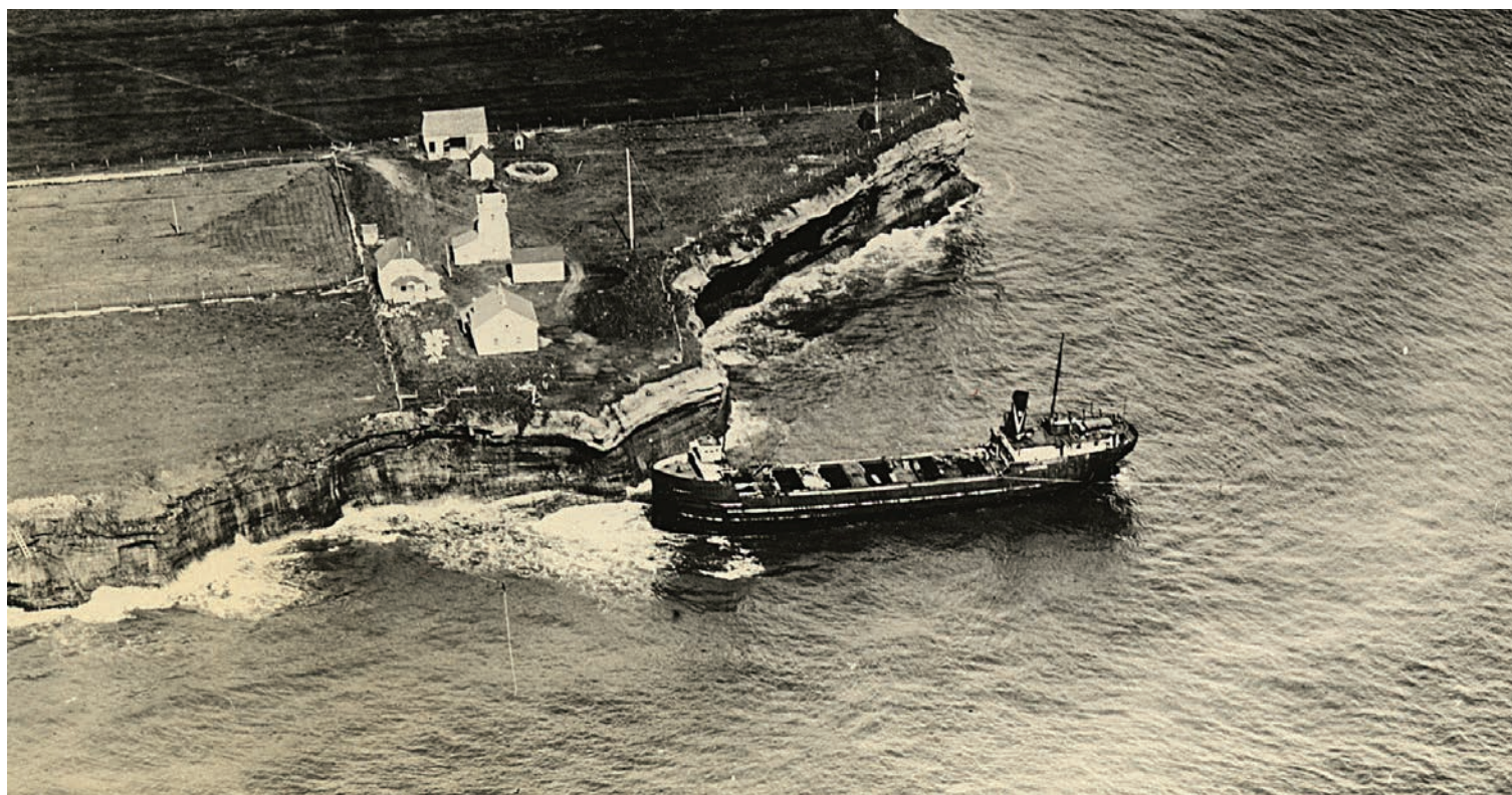
Charbonnier A.D. Mactier, échoué à la pointe de Cap-d'Espoir le 21 avril 1926. Les gens de Cap-d'Espoir ont récupéré bien des choses du navire : table, chaises, bouées, plat de service. Ils ont vidé de navire du charbon pour se chauffer. Ce charbonnier sera vendu pour le métal en 1939.

Photo : Jacques De Lesseps. Musée de la Gaspésie, collection Centre d'archives de la Gaspésie. P57/26/23.