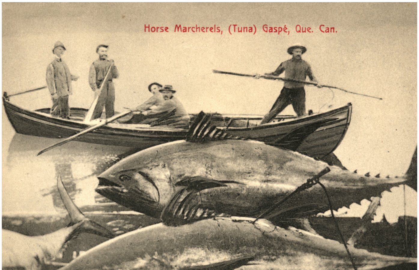
Horse Marcherels, (Tuna) Gaspé, Que. Can.