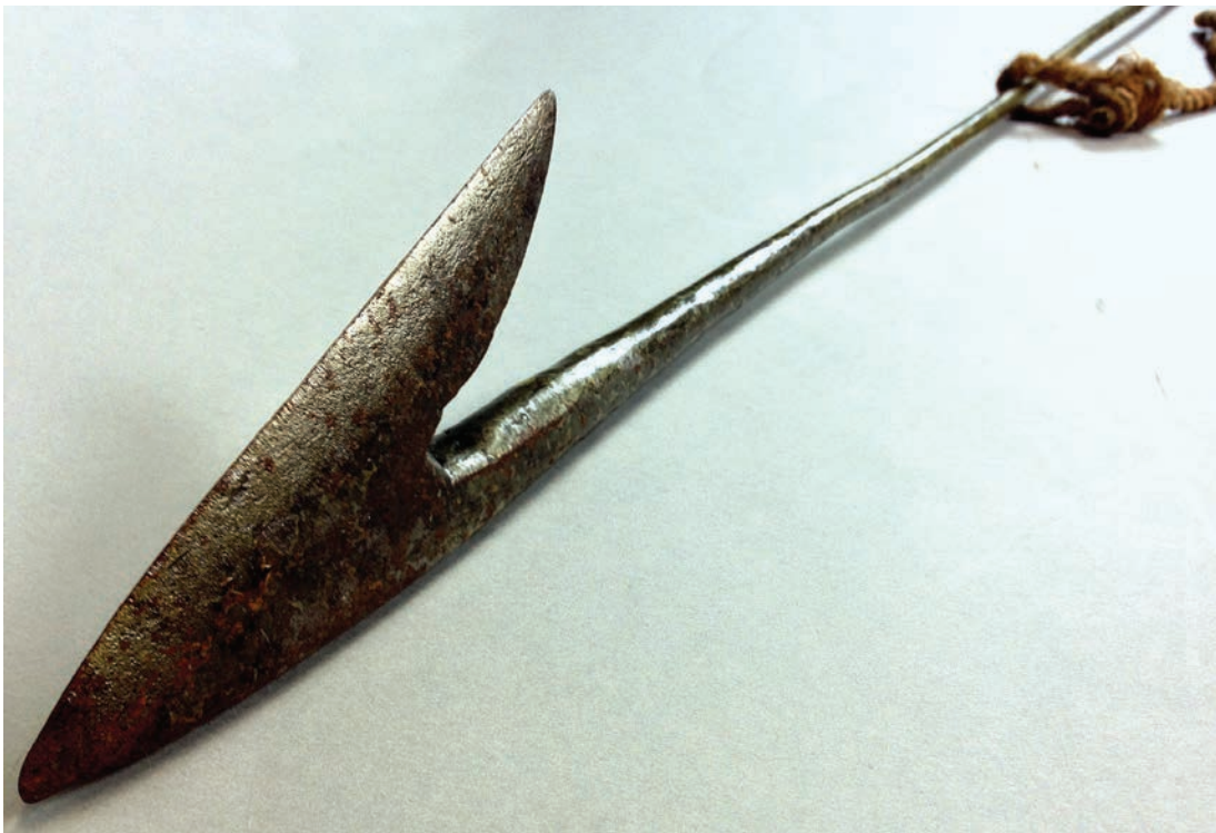
Tête de harpon dans son emboîture NAC : 1974.69.3.