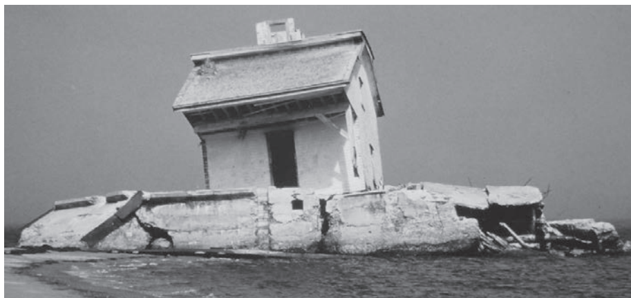
La maison phare au bout du banc de Sandy Beach, 1980.

Ce nom souligne la mémoire de Guy Carleton (1724-1808), plus connu sous le nom de lord Dorchester, gouverneur en chef de la province de Québec de 1768 à 1778 et de 1786 à 1796.