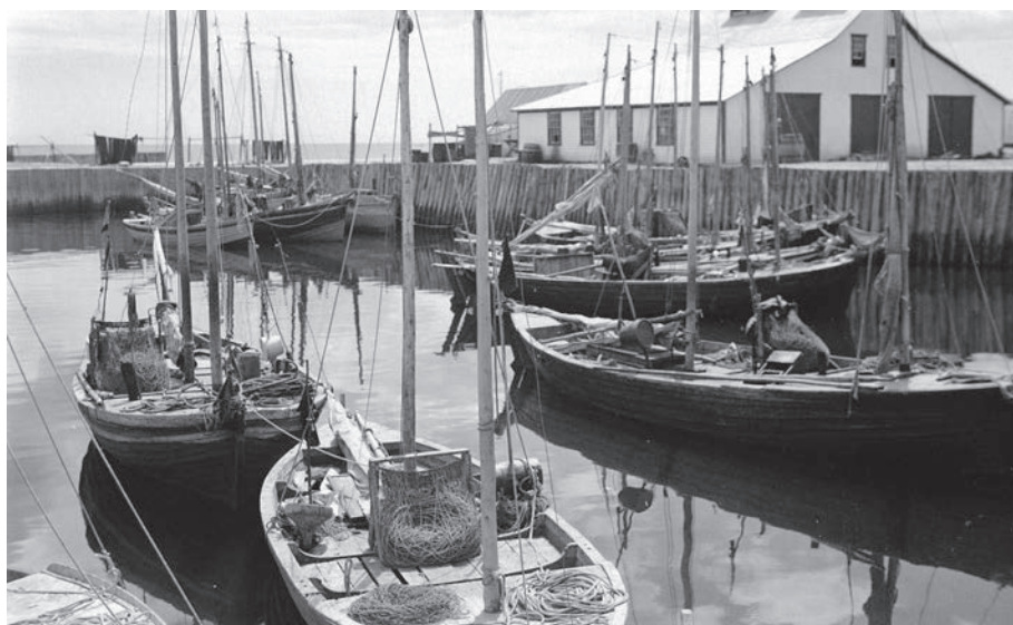
Havre de Newport.

Ce hameau doit son nom à sa longue plage sablonneuse.