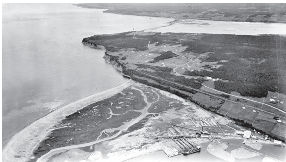
Cap Haldimand, 1926.

P141/1/5/15/34.