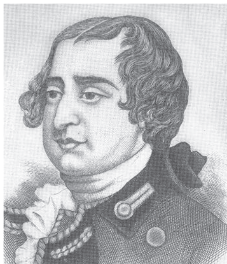
Sir Guy Carleton.