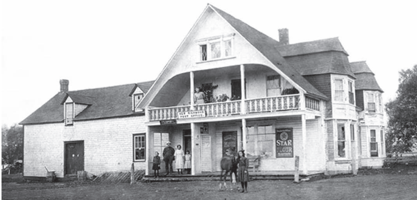
Magasin Campbell, 1910.