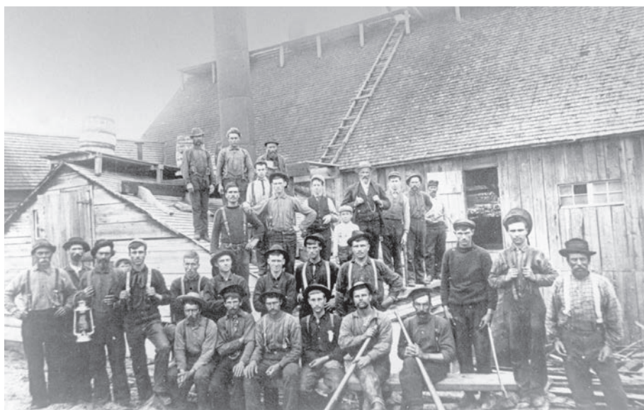
Travailleurs au moulin Montgomery vers 1900.