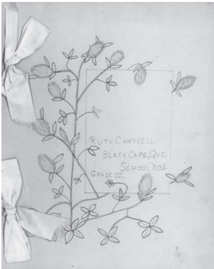
Cahier d'écolier de Ruth Campbell, descendante écossaise, de Black Cape à New-Richmond, vers 1913.

Source : Musée de la Gaspésie. Collection Centre d'archives de la Gaspésie. P57/24/33.