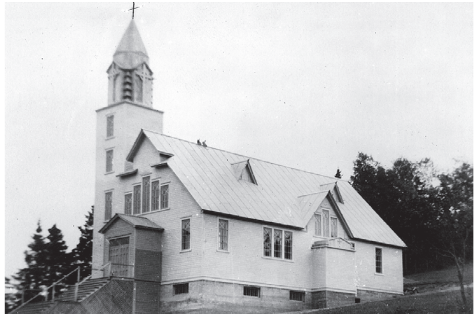
Le sanctuaire de Pointe-Navarre.