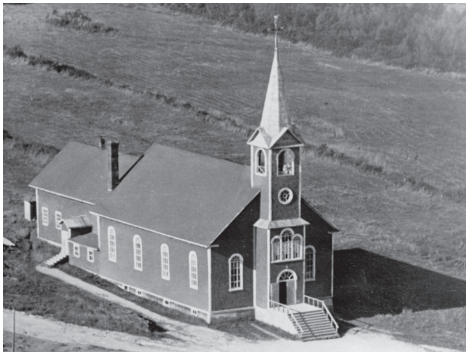
Première église de Val-d'Espoir (1932-1955). Elle a été démolie en 1972.