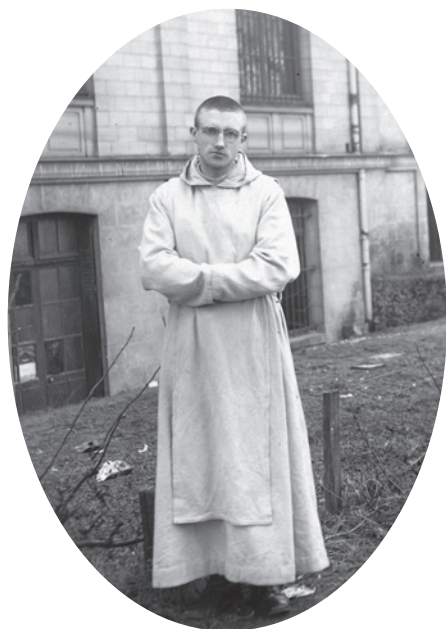
« Les cisterciens comme celui-ci ont été les premiers à battre un chemin dans le rang 8 de Val-d'Espoir. »