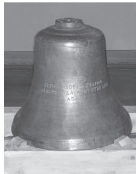
Cette cloche de la première église de Val-d'Espoir, retrouvée en 2012, est maintenant dans la nef de l'église actuelle.

salle de spectacles, entrepôt, remise pour le bois de chauffage, etc. Elle a été démolie en 1972, ne conservant que la sacristie, unique vestige d'un passé valeureux et prolifique. Cette sacristie est aujourd'hui le Centre de loisirs de Val-d'Espoir. La cloche de cette vieille église a été retrouvée en 2012 et trône