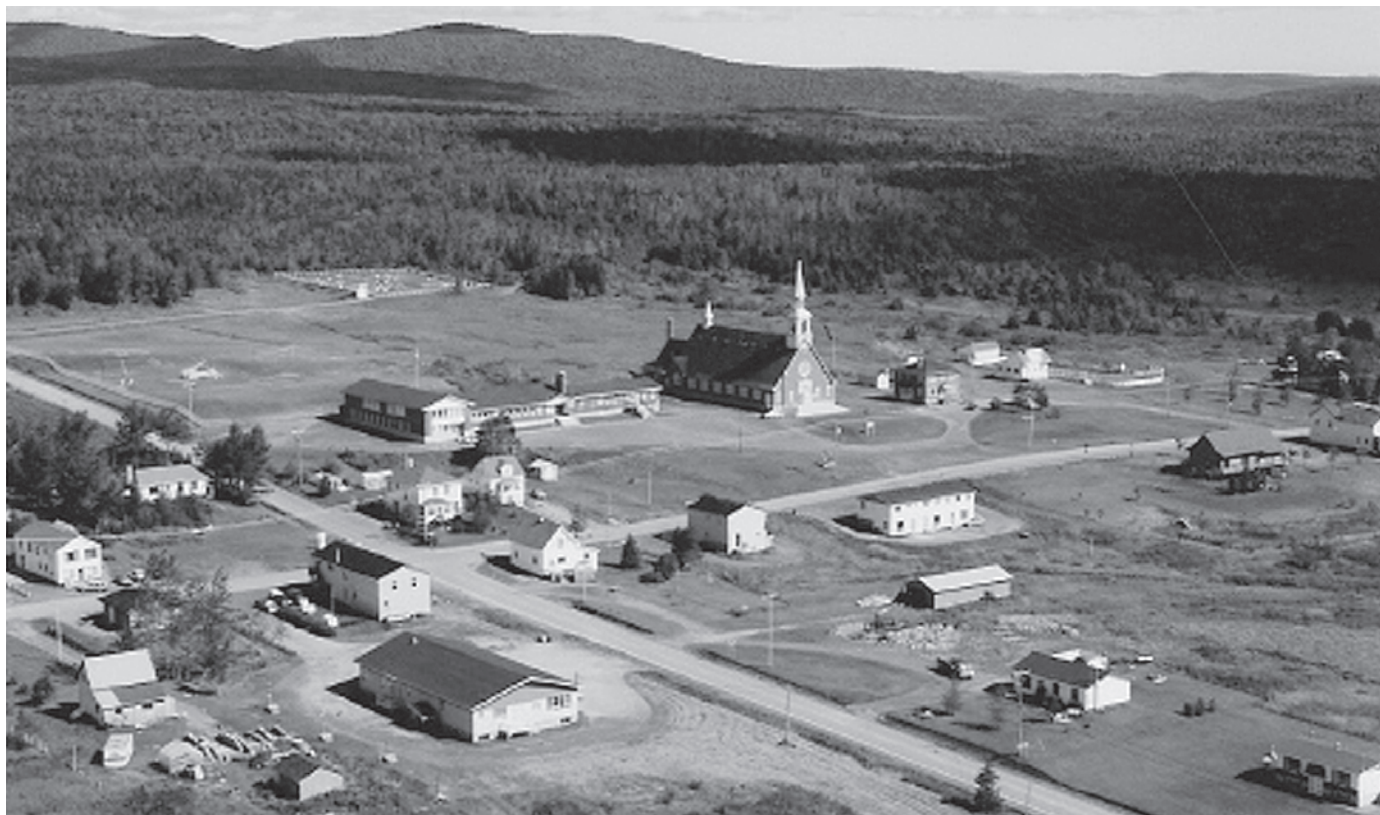
Val-d'Espoir est un village type de la période de la colonisation de l'arrière-pays gaspésien dans les années 1930.