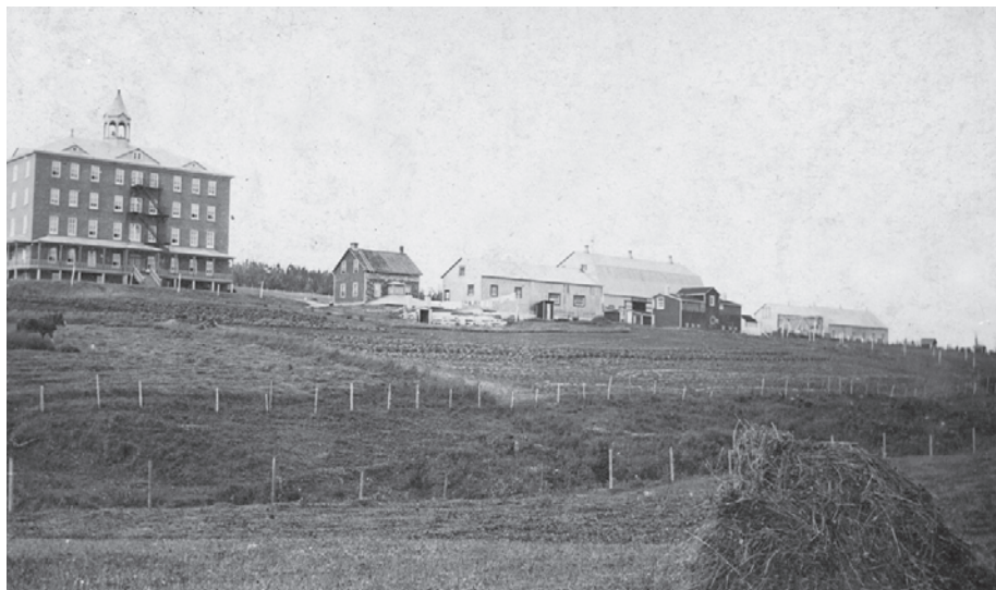
Monastère des Cisterciens (1928-1935) et domaine de l'École d'agriculture des Clercs de St-Viateur (1927-1961).