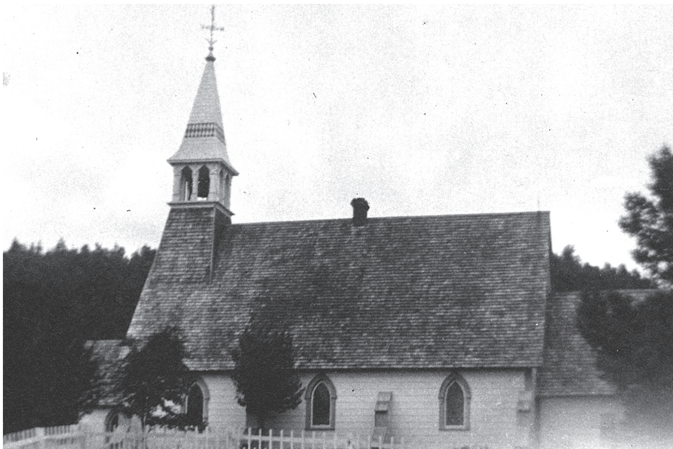
Église St. Luke, entre 1900 et 1930

Photo : Musée de la Gaspésie. Fonds Famille Daniel Mabe. P68/3b/23.