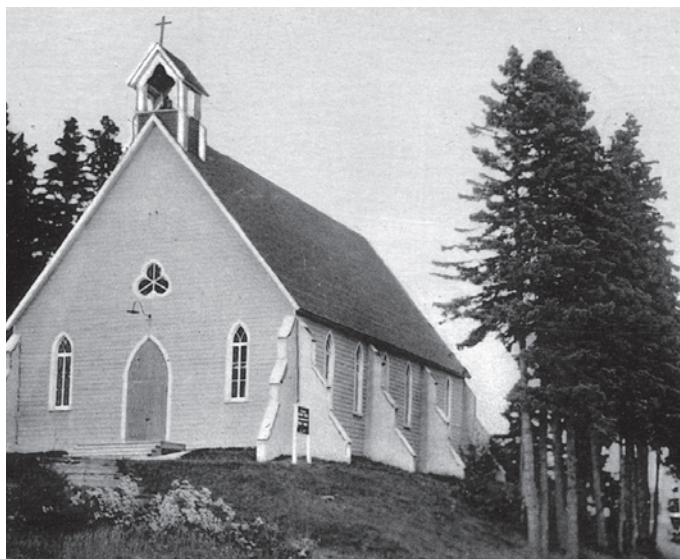
Église Saint-Paul de Gaspé, vers 1930. Cette église a passé au feu en 1939. P162/5.