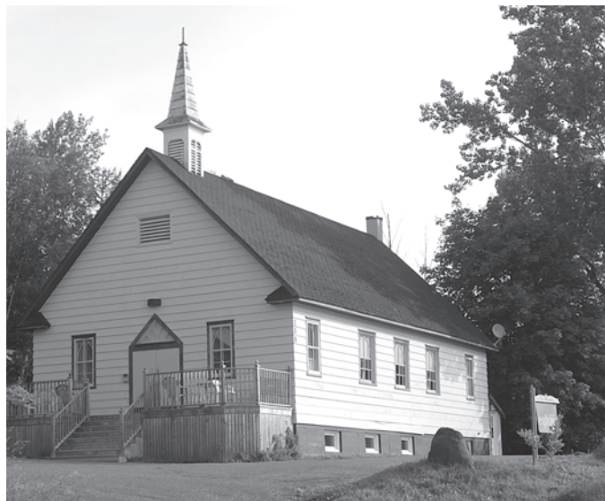
L'ancienne église anglicane Saint-Paul de Gaspé a été convertie en une salle de spectacle, La Petite Église.