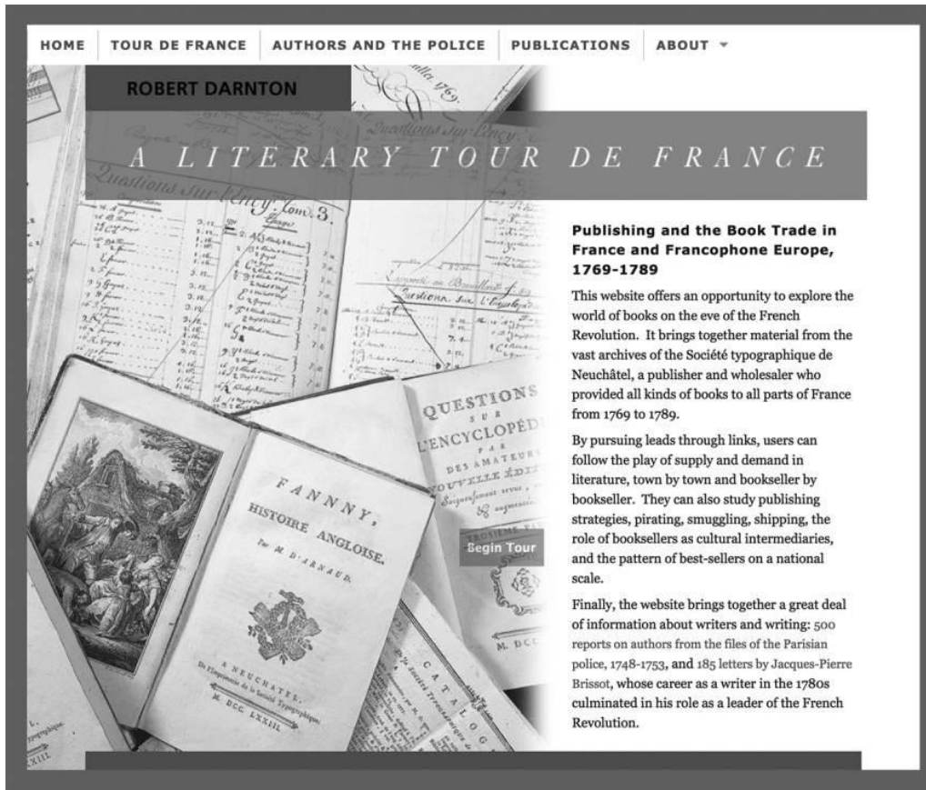
Figure 1. Page d'accueil du site Web www.robertdarnton.org . Image couleur accessible en ligne.

Le contenu est disposé en couches pour que les lecteurs puissent traverser ces strates d'information en fonction de leurs intérêts, tout en gravitant autour de la question centrale de la demande de livres. Avant de plonger, toutefois, ils s'interrogeront sans doute quant à la méthodologie et aux sources utilisées. L'article vise, en troisième lieu, à fournir à ces questions des réponses qui pourront se révéler utiles aux historiens d'autres disciplines soucieux d'élaborer une stratégie de recherche efficace.