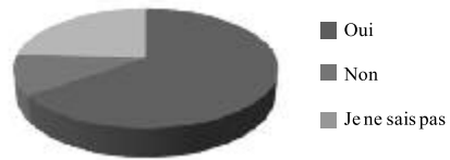
Figure 2. Question 15: Possibilité d'amélioration du questionnaire d'avis pédagogique

En ce qui concerne la prise en compte des avis pédagogiques dans les procédures de promotion, les répondants se répartissent en trois groupes presque équivalents (28 % de « oui », 36 % de « non » et 37 % de « je ne sais pas »). Par contre, ils sont deux tiers à estimer que les formulaires d'avis pédagogiques peuvent être améliorés. Une autre enquête menée auprès des présidents de commissions pédagogiques de la même université (chacune des 10 facultés de l'institution comptant au moins une commission) montre que ces formulaires sont en constant remaniement (Salcin & Robert, 2012).