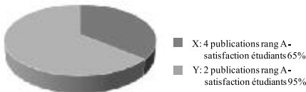
Figure 4. Scénario 1 : Cas d'une demande de promotion

Le candidat X Le candidat Y Commentaires éventuels :