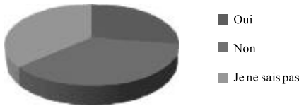
Figure 1. Question 14: Prise en compte des avis pédagogiques dans les commissions de promotion d'avis pédagogique

La question suivante (question 15) demandait aux enseignants-chercheurs si les formulaires d'avis pédagogique utilisés au moment de la passation du questionnaire pouvaient être améliorés. À noter que ces formulaires varient selon les facultés mais aussi parfois selon les corps d'enseignants ou le type d'enseignement évalué (cours ex cathedra , travaux pratiques, laboratoires et parfois même les stages). Les procédures et les règlements qui les organisent diffèrent également d'une faculté à l'autre mais une réflexion est actuellement menée au sein de l'institution en vue de tenter de les homogénéiser.