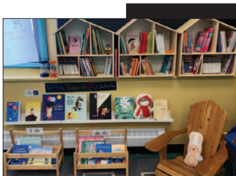
Un environnement de lecture inspirant