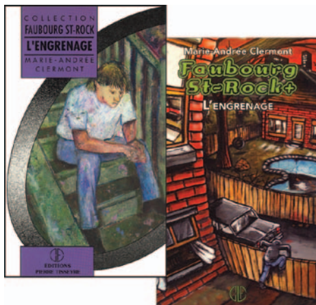
Première et dernière édition de L'engrenage