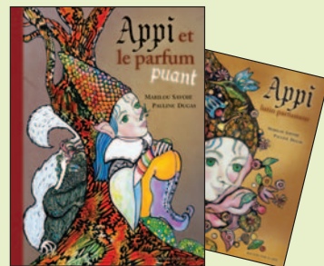
APPI ET LE PARFUM PUANT & APPI LUTIN PARFUMEUR